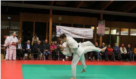
Le Montat 46