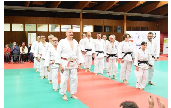
Remises Diplômes 1 er Dan