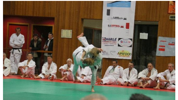
Judo Quercy Vert