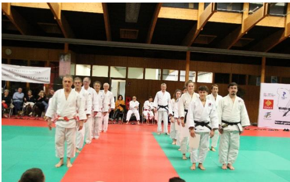
Remises Diplômes 1 er Dan