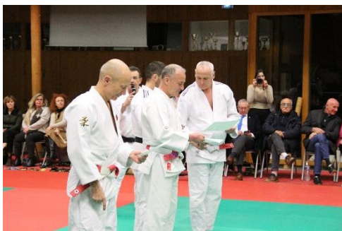
Les hauts gradés remettent les diplômes d'implication