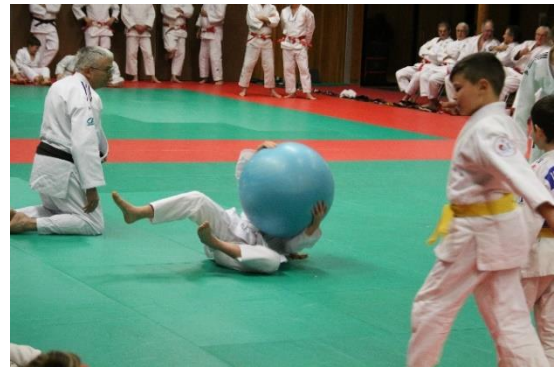
A la fin de l'animation les jeunes poussins invitent les hauts gradés pour le randori de l'amitié