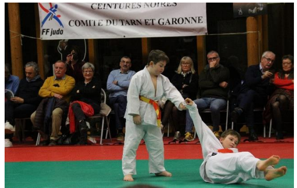
Démonstration technique de jeunes poussins du judo club de Verdun sur Garonne