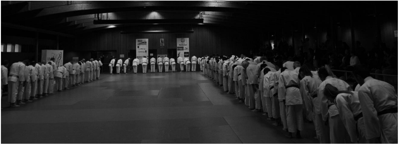
Photo de Famille du Kagami Biraki 2023 en Tarn-et-Garonne