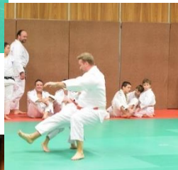
Notre Président en difficulté