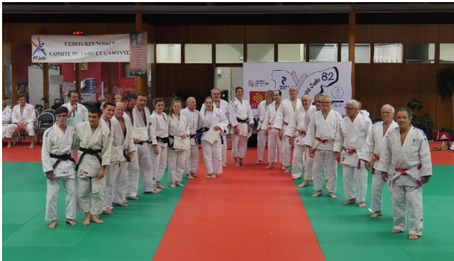
Remises Diplômes 1 er Dan