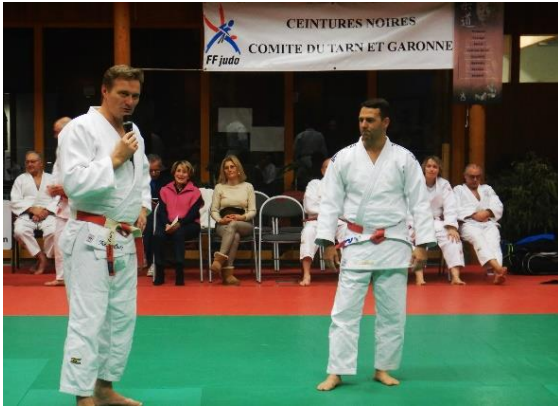
Mise à l'honneur