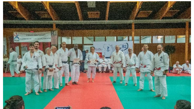
Remises Diplômes 2 ème Dan