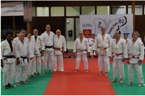
Remises Diplômes 5 ème Dan