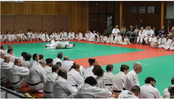
Prestation Libre Judo et Ju - Jitsu