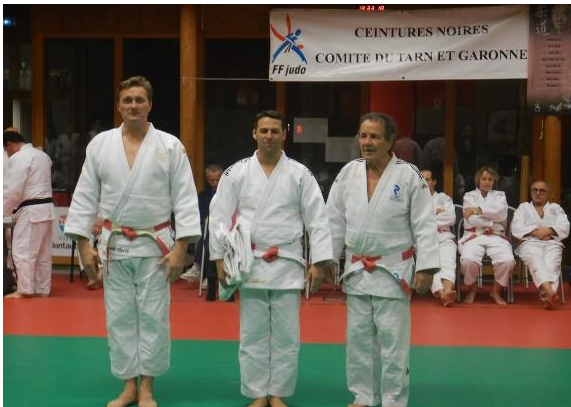
Nouveaux Promus 6 ème Dan