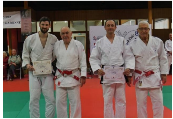
Remises Diplômes 4 ème Dan