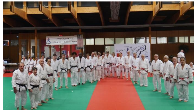
Remises Diplômes 1 er Dan