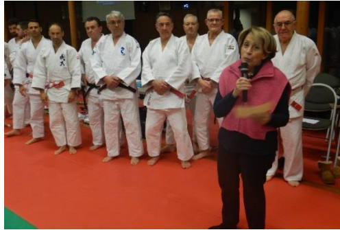
Le discours de Madame Brigitte BAREGES Maire de Montauban qui clôture la cérémonie 2024