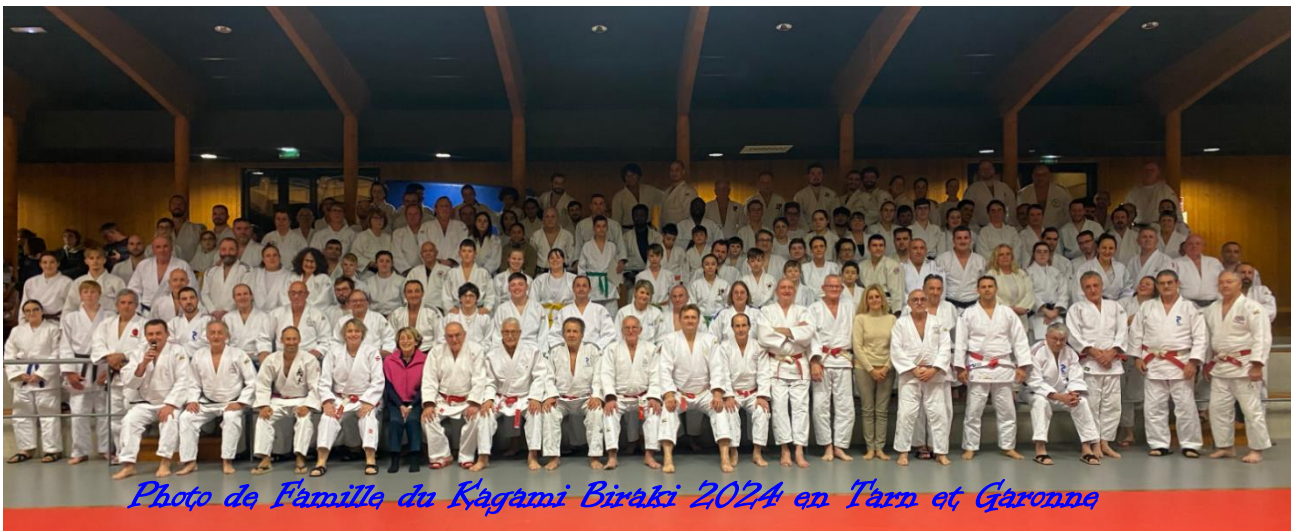
Photo de Famille du Kagami Biraki 2024 en Tarn et Garonne

Remerciements à nos photographes bénévoles qui ont immortalisé cette cérémonie du Kagami Biraki 2024